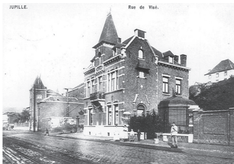
1. Château PIEDBOEUF