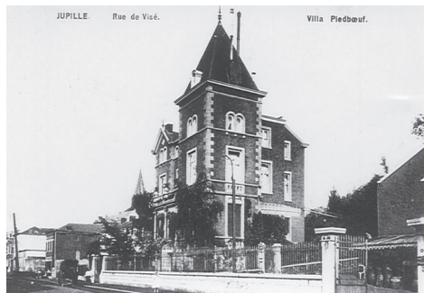
2. Château PONSON